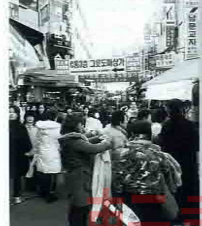
韓国をはじめ、海外旅行はさらに安く...

ありますが、今回も同じ。ちよつと4月中旬頃から日米とも株価が下落する可能性があるわけですが、その後アメリカでは、様々な経済指標が発表されるたびに実体経済の悪化が明らかになり、世界中が失望する。特に秋以降は株価の下落が顕著になり、日経平均は7000円程度まで、ダウ平均は5000円、くらくらまで暴落するだろう。(植木氏)