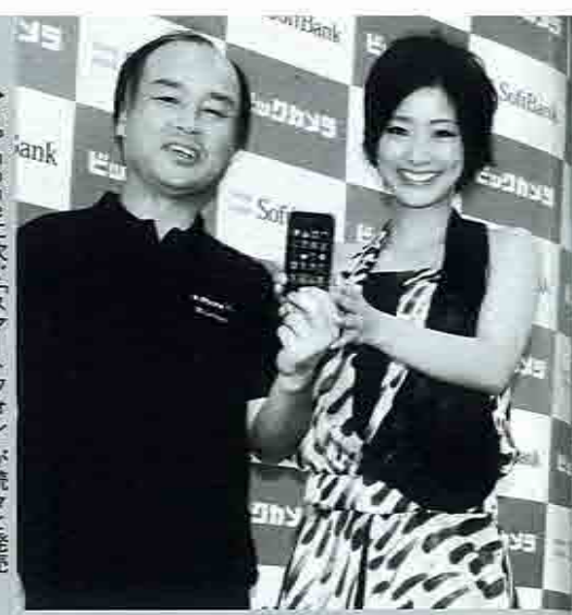
iPhoneに次ぐ「スマートフォン」が続々と発売。本場の意味で円高が還元されるのはこれから