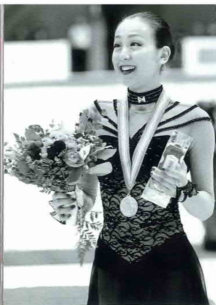
▶昨年暮れ、渡米してUFCを視察した石井慧。早ければ、今春にも対戦が実現する見込みの小椋と藤田。昨年12月13日のGPPファイナルで、女子史上初の「トリプルアクセル×2」を決めて逆転Vを飾った浅田真央