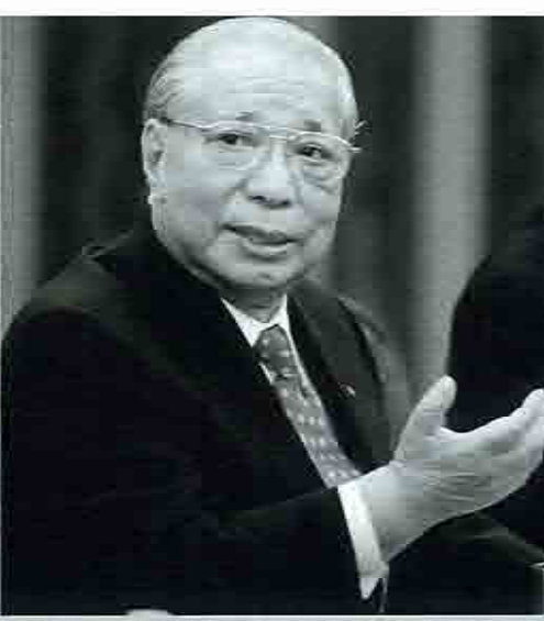
▲「カリスマ」池田名誉会長も体調不安が懸念されるが...