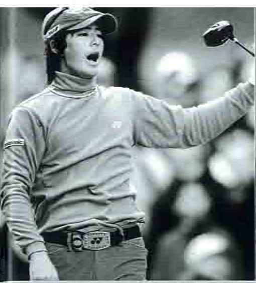
▲「来季にも賞金王を目指せる」と評される石川遼