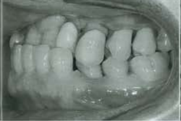
▲歯周病患者の歯茎。腫れて根元がむきだしになっている